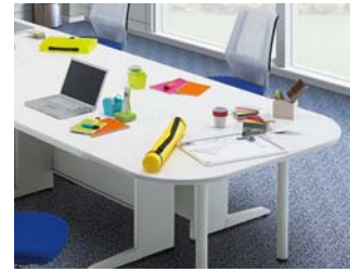
サイドテーブル/TC50JTH-C147WW使用例

デスクサイドエッジに付属の金具でテーブルを取り付けることができます。テーブル取り外し後のサイドエッジキャップも用意しております。 ※脇デスクにはテーブルの取り付けはできません。