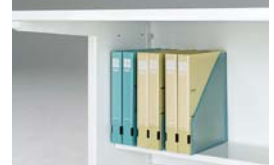
A4タテファイル収納