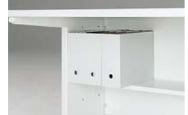
A4ヨコファイル収納